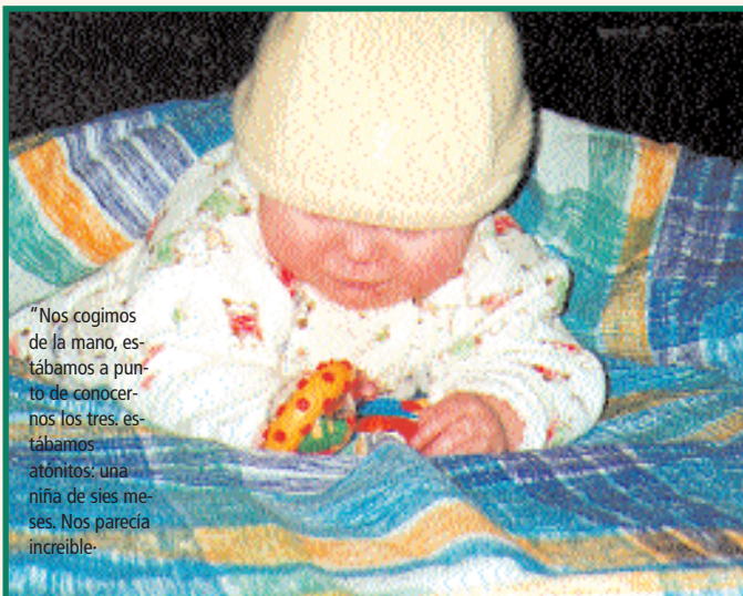
"Nos cogimos de la mano, estábamos a punto de conocernos los tres, estábamos atónitos: una niña de seis meses. Nos parecía increíble."

Llegamos y nos recibieron con el mismo cariño que la primera vez. Ya de camino al hotel preguntamos que cuál era el problema de nuestra hija, y nuestra representante legal con cara de sorpresa nos devuelve la pregunta: "¿Qué problema?" Le explicamos la situación y nos dice que habrá sido una manera "elegante" por parte de nuestra representante en Moscú de advertirnos que nuestra sentencia no estaba muy clara, pero que de ningún modo era por problemas de la menor sino míos... ¿Míos? ¡Oh, claro! ¡mi enfermedad crónica!. Parecía que el mundo se me hubiera tragado, ahora me veía como la gran culpable de que por el momento, aquella niña se fuera a quedar sin unos padres que la deseaban con todo su corazón... me sentía mal