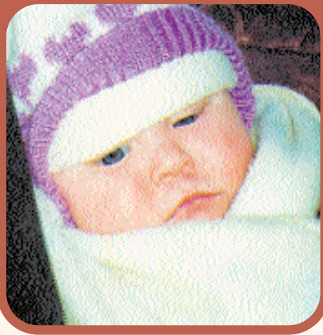
Texto y fotos: Victor Romero y Merche Yll Escot